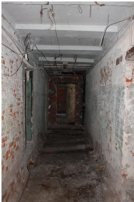
Фото 4. Помещение 4