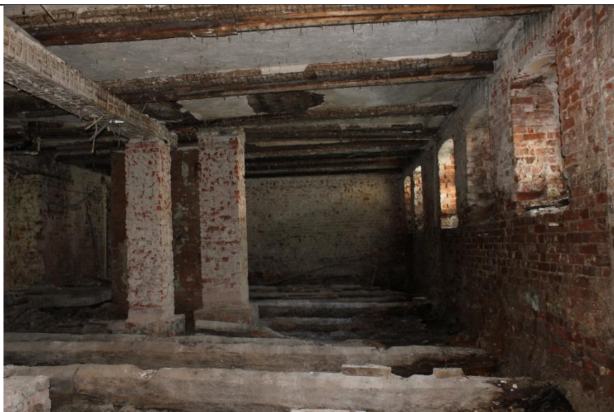
Фото 3. Помещение 3